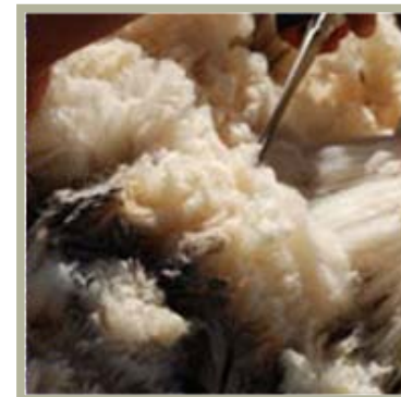
Vellón sin lavar

A pesar de ser un material contemporáneo, evoca al labor artesanal ya que era utilizado hace siglos por el hombre. Con este proyecto se propone revalorizar un material ecológico retomando las costumbres artesanales del hombre e incorporando la industria al proceso de fabricación explorando nuevas variantes de uso tanto en arquitectura como en moda, diseño industrial. etc.