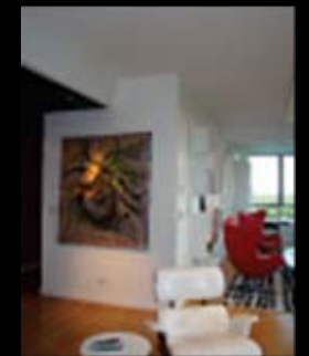
Stand Feria Puro Diseño 2010